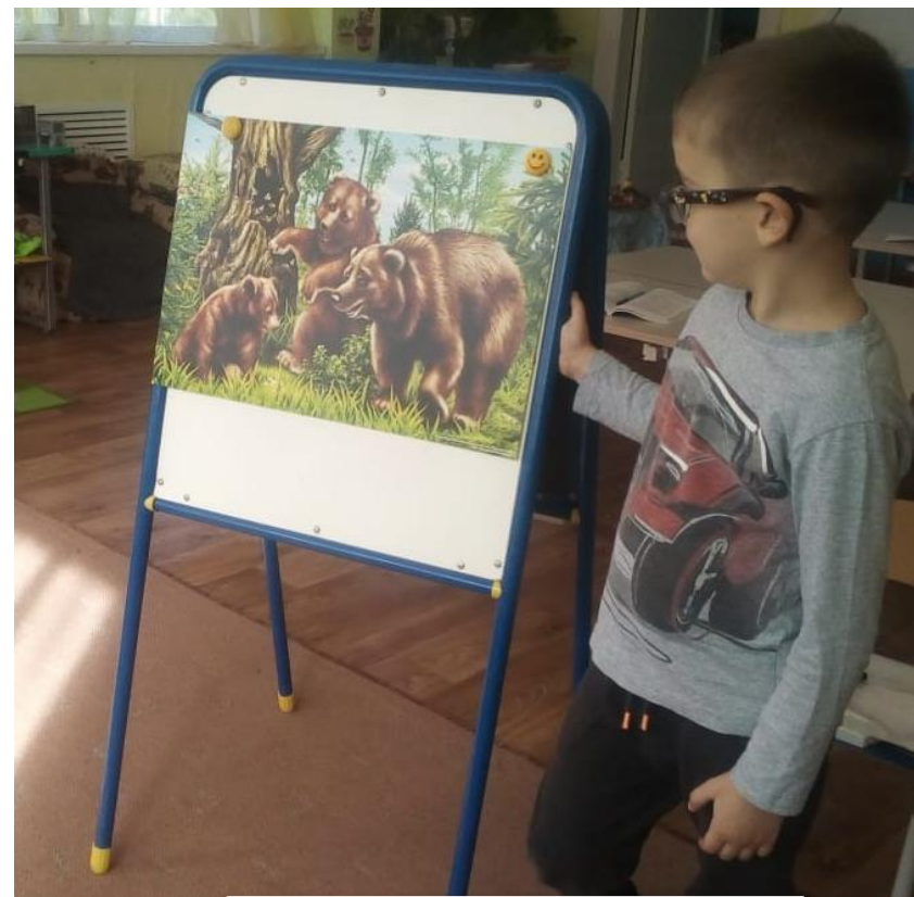
Пересказ сказки «Купание медвежат»