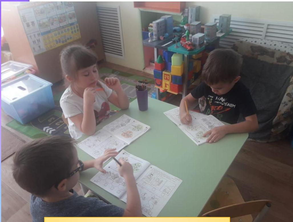
Работа в тетрадях

«Ориентировка во времени; определение времени на часах»