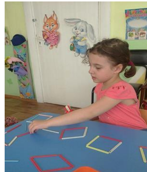
Выкладывание геометрических фигур с помощью счетных палочек